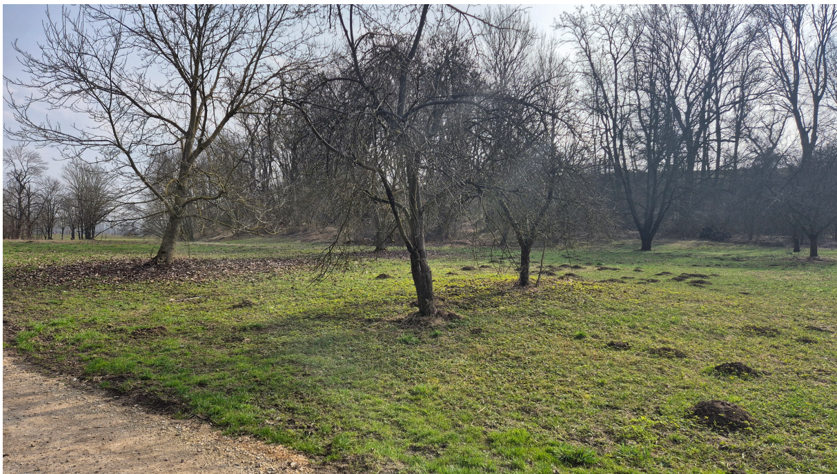
Obrázek 1: Fotografie místa (02/2024)

Plocha určená pro stavbu pumptracku je převážně rovná, zatravněná, s porostem stromů. Na severní straně plochu lemuje nezpevněná komunikace vedoucí k odpočinkovému místu Za Mlýnem. Nyní je celý prostor pro stavbu dráhy nevyužitý. V budoucnu se uvažuje s využitím areálu u bývalého mlýna s využitím pro trávení volného času, rekreace a sportovních aktivit.