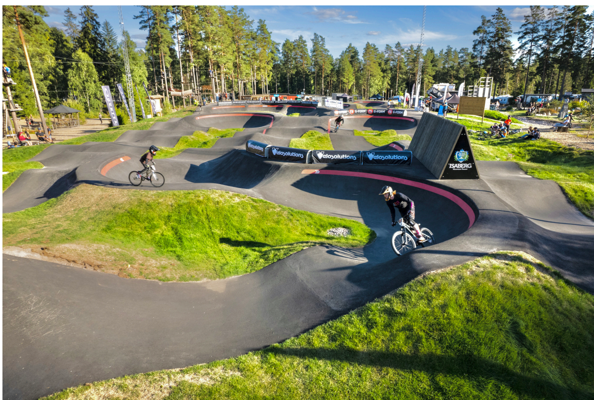
Obrázek 4: Ukázka – plochý wallride - Pumptrack Isaberg

Pumptrack je navržený jako 181 metrů dlouhá dráha s asfaltovým povrchem. Celé sportoviště zaujímá prostor o celkové ploše 1 581 m 2 . Asfaltová plocha dráhy bude mít rozlohu 551 m 2 . Součástí stavby bude 7 klopených zatáček. Výška klopených zatáček bude 1,3 m a výška vln v rozmezí 0,3 – 1,2 metrů. Vstup na pumptrack bude z jedné strany po přístupovém chodníku na rozjezdovou platformu. Součástí dráhy bude plochý wallride, umístěný mezi dvěma jízdními stopami.