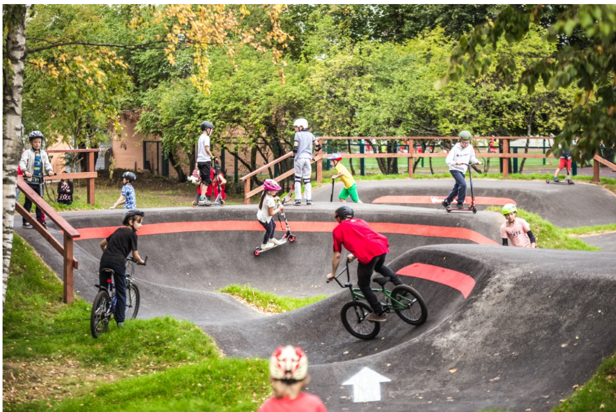
Obrázek 3: Ukázka využití dráhy - Pumptrack Jarsvo